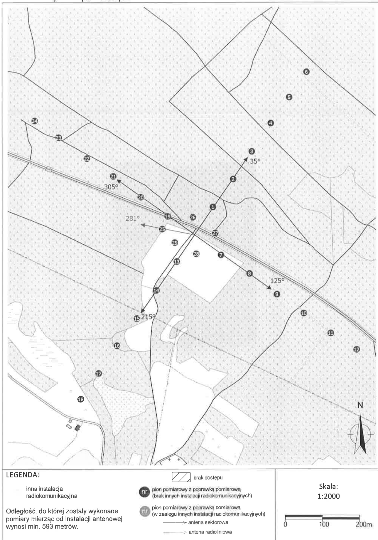
Zał. 2. Widok pionów pomiarowych