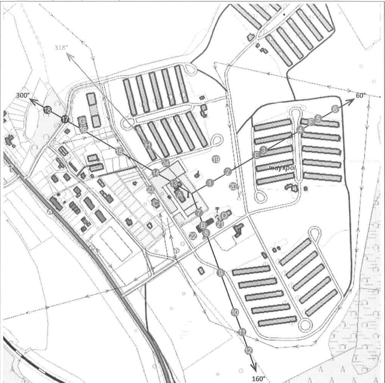
Załącznik 2. Widok pionów pomiarowych