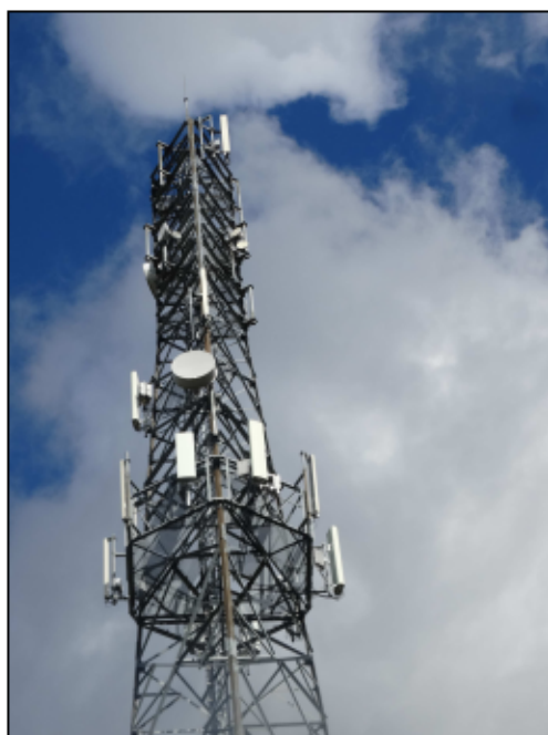
Rys. 3 Widok badanego obiektu