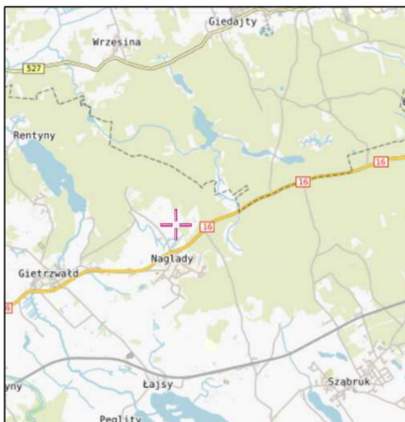
Rys. 1 Lokalizacja badanego obiektu