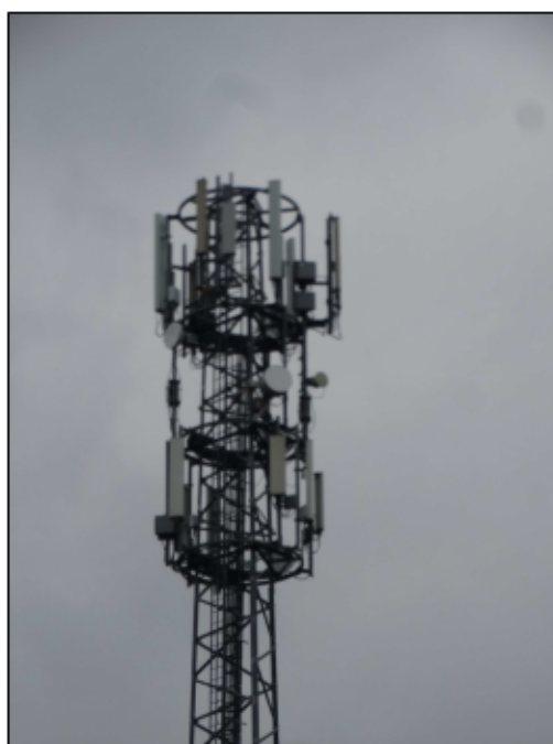
Rys. 3 Widok badanego obiektu